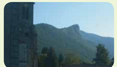
Le géant endormi