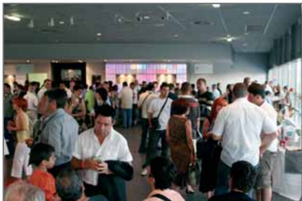
Réception des sportifs à la Bodéga du Téf

le 19 juin dernier, le COSAT réunissait à la Bodéga du Téf, tous les sportifs des sections et associations du COSAT. Cette soirée a été marquée par la remise des trophées COSAT en présence de Monsieur Pierre COHEN Maire de la ville et d'élu, l'occasion de souligner les performances de nos adhérents qui défendent haut les couleurs de notre ville dans diverses compétitions.